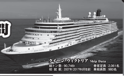
クイーン・ヴィクトリア Ship Data 総トン数: 90,746t 乗客定員: 2,061名 初就航: 2007年(2017年6月改裝) 乗組員数: 980名