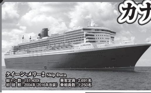
クイーン・メリー2 Ship Data 総トン数: 151,400t 乗客定員: 2,691名 初就航: 2004年(2016年改裝) 乗組員数: 1,250名