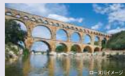
ローヌ川イメージ

色鮮やかな南フランスのブルゴーニュ地方やプロヴァンス、カマルグをめぐるクルーズです。ローヌ川、ソーヌ川をゆくこのクルーズではフランス流の人生の楽しみ方や素晴らしい景色を堪能していただけます。美食の街リヨンから始まりリヨンで終わるクルーズでは、ブドウ畑を通りながらメイコンやワインで有名なボジョレーを巡ります。また教皇宮殿が有名なアヴィニオンやカマルグの自然保護区、アルデシュの渓谷などが見どころです。