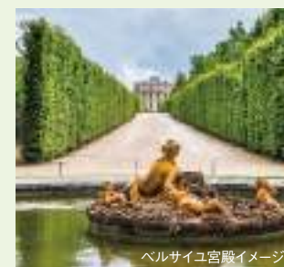
ベルサイユ宮殿イメージ

花の都パリを発着地とするクルーズ。印象派絵画の巨匠、ゴッホ、セザンヌ、そしてゴーギャンらの軌跡をパリからセーヌ川下流のルーアン、続いてノルマンディー地方のコドゥベック＝アン＝コーへと辿ります。第二次大戦中のノルマンディー上陸作戦で有名なビーチを訪れるエクスカーションもご紹介します。