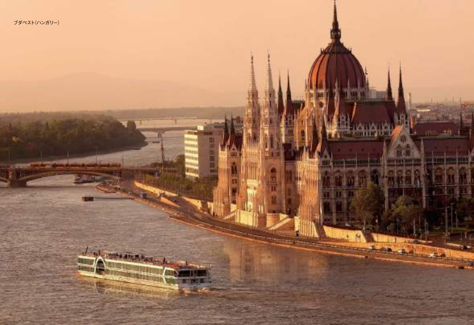
ブダペスト(ハンガリー)