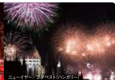
ニューイヤー/ブダペスト(ハンガリー)