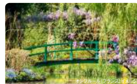
オンフルール(フランス)イメージ