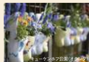
キューケンホフ公園(オランダ)

アムステルダム、ゲント、アントワープなど、絵画のように美しい場所を訪れるクルーズです。特殊な水路に沿って、世界で最も美しいとされる壮大なチューリップ畑や有名な園芸を訪問します。オランダの南部に位置するキューケンホフ公園は、ヨーロッパ最大の花園で、春には世界でいちばん美しいと言われる「ヨーロッパの庭園」です。チューリップや水仙、ヒヤシンスなど700万本以上の花が咲き誇る、この時期にしか見ることのできない景観をぜひご覧ください。