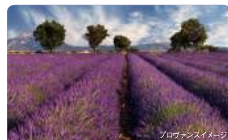
プロヴァンスイメージ

オランダの水路や歴史的に重要なライン川、マイン川、ドナウ川を下り、ヨーロッパの魅力ある街々を訪れます。アムステルダムや、2000年以上の歴史をもち世界遺産に指定されている大聖堂のあるケルンなどの都市のほか、美しいブドウ園を訪れることもできます。