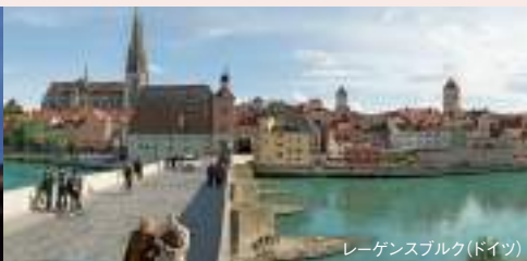
レーゲンスブルク(ドイツ)