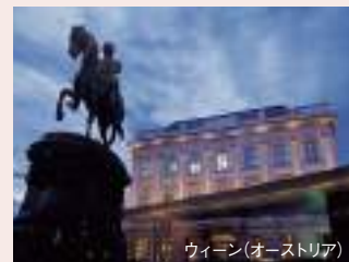
ウィーン(オーストリア)

1年の終わりと、新年を祝うクルーズです。大晦日には、クルーズのハイライトとなる船上のシルベスター(大晦日)ガラが催されます。そして、人々が街に繰り出し、時計台が新年の0時を知らせるのを待つ中、アマデウスの船のサンデッキから街のまばゆい光を眺め、ワルツを踊りながら新年を迎えます。