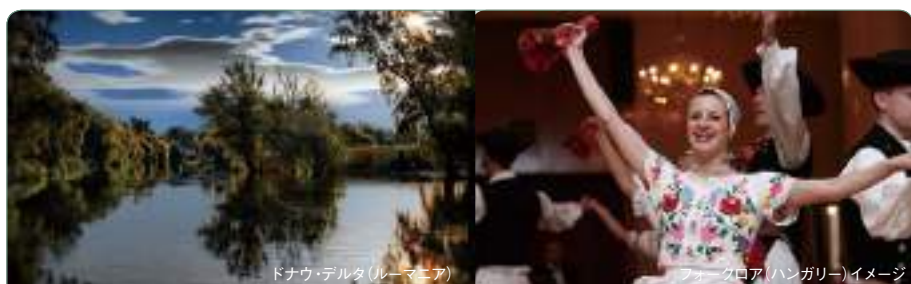
ドナウ・デルタ(ルーマニア)