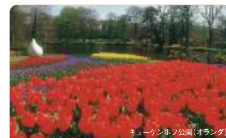
キューケンホフ公園(オランダ)