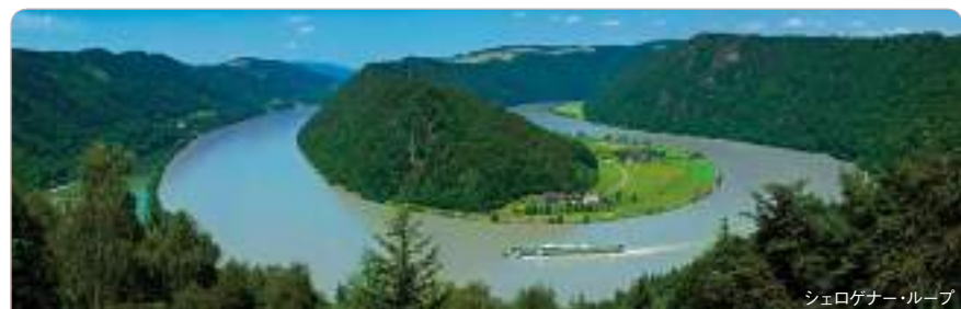
シュロケナー・ループ