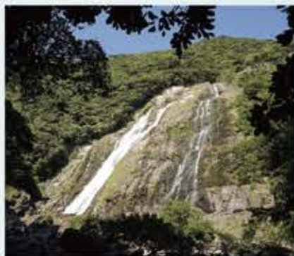
大川の滝 ~ 豪快に轟く姿は圧巻！

マイクロバスでしか入れない細い道を進む。島固有の鹿や猿が頻りに出て来てくれます。