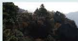
寒霞渓～ロープウェイで