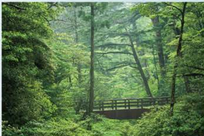
ヤクスギランド ~ 散歩で感じる千年の歴史

名前こそ可愛い感じですが、一步踏み込むとそこは私達が想像する鬱蒼とした屋久島の森そのもの。実は白谷雲水峡よりも高度も高い。屋久杉を見るならとてもお勧めです。