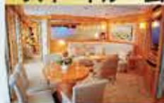
グランドスイート 79㎡・2名1室利用