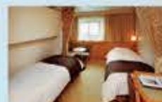
コンフォートステート 14㎡・2~3名1室利用