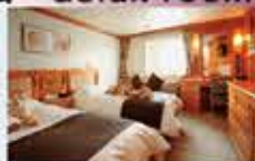
デラックスツイン 19㎡・2名1室利用