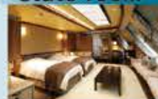
スーベリアコンセプトルーム 42㎡・4~5名1室利用