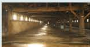
マルキン醤油醸造所