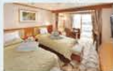
ジュニアスイート 31㎡・2名1室利用