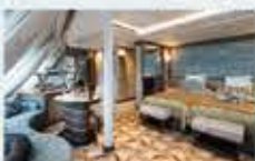
オーシャンビュースイート 33㎡・2名1室利用