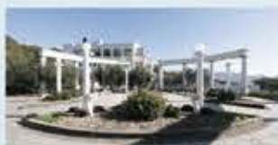
道の駅オリーブ公園