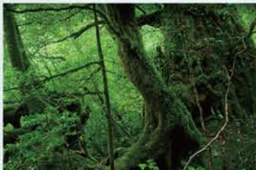
白谷雲水峡 ~ 迷い込むもののけの世界

映画もののけ姫の舞台となったことで知られる。屋久島の深い神秘の森を体感できる場所。