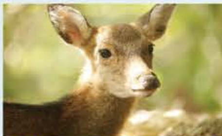
西部林道 ~ ヤクシカの待つ世界遺産地域

名前こそ可愛い感じですが、一步踏み込むとそこは私達が想像する鬱蒼とした屋久島の森そのもの。実は白谷雲水峡よりも高度も高い。屋久杉を見るならとてもお勧めです。