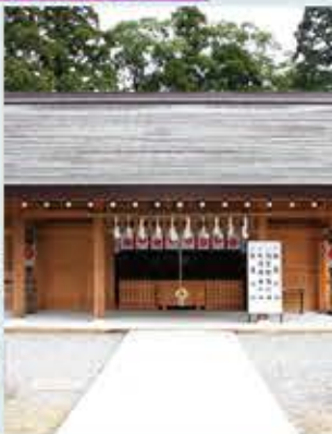
大洲神社と城下町

江戸時代は宇和島伊達家の居城。四国の名峰を背景に堂々と佇み、鶴島城の別称を持つ。