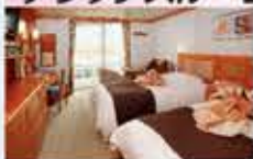
デラックスペランダ 24㎡・2名1室利用