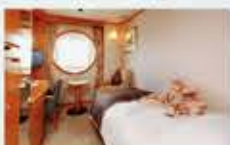
デラックスシングル 13㎡・1名1室利用