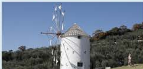
ギリシャ風車～オリーブの丘

島内を見下ろす丘の上で清々しいひととき。樹齢100年のオリーブもあり見応え抜群。