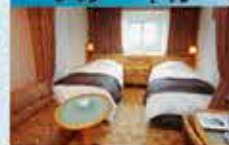
スーベリアツイン 14~18㎡・2~3名1室利用