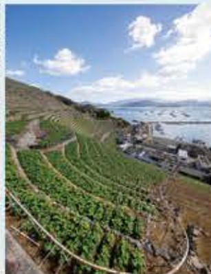
ゆずみずがうら 遊子水荷浦の段畑

歴史建造物や古民家の並ぶ街並みは、まるで江戸時代にタイムスリップしたような感覚。