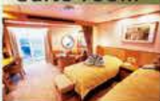
ビスタスイート 37㎡-42㎡・2名1室利用