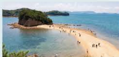
エンジェルロード

島内を見下ろす丘の上で清々しいひととき。樹齢100年のオリーブもあり見応え抜群。