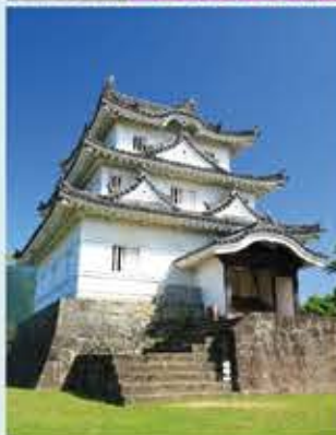
宇和島城～1596年築城開始

江戸時代は宇和島伊達家の居城。四国の名峰を背景に堂々と佇み、鶴島城の別称を持つ。