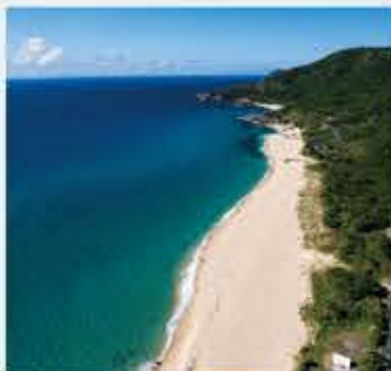
いなか浜 ~ 海亀の来る浜

映画もののけ姫の舞台となったことで知られる。屋久島の深い神秘の森を体感できる場所。