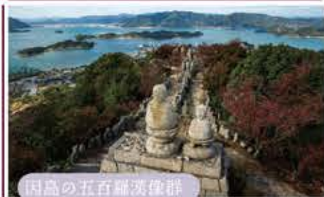
因島の五百羅漢像群