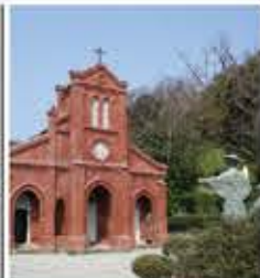
世界遺産 堂崎教会

密かな信仰を続けた教徒達が最初に建てたといわれる歴史ある教会。内部には堂崎天主堂キリシタン資料館がある。