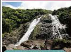
大きい川が滝になる つまり、大川の滝。

いくつかのツアーで訪れる大川の滝（おおこのたき）は圧倒的なスケールです。轟音をたてながら流れる様子を見ていると、地球が確かに躍動しているのだと肌で感じます。