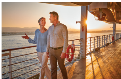
正装不要で カントリークラブ・カジュアルが基本