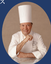
オーシャニアクルーズの マスターシェフ ジャック・ペパン氏

また、レストラン以外にもホライズンズでは、アフタヌーンティーをお楽しみいただけます。