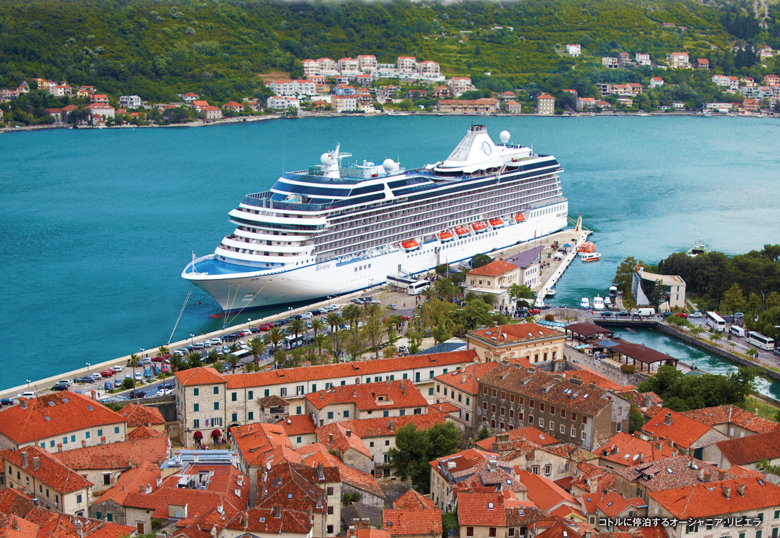
コトルに停泊するオーシヤニア・リビエラ