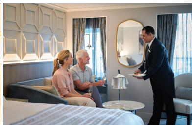
1.6~1.7名に対し乗員が1人の 細やかなおもてなし