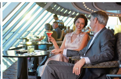
ドリンクパッケージやWi-Fi無料など 特典盛りだくさん