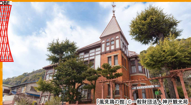
「風見鶏の館」