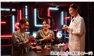
温泉ミスト作り体験(イメージ)

また、別府を知り尽くした温泉まち歩き名人が登場し、別府の歴史やおすすめの観光スポット、悩みに合わせた湯めぐりの提案などを聞くことができます。