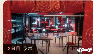
2日目 ラボ イメージ