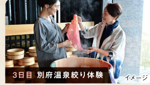
3日目 別府温泉絞り体験 イメージ