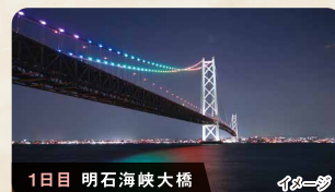
1日目 明石海峡大橋 イメージ