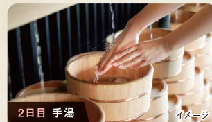
2日目 手湯 イメージ