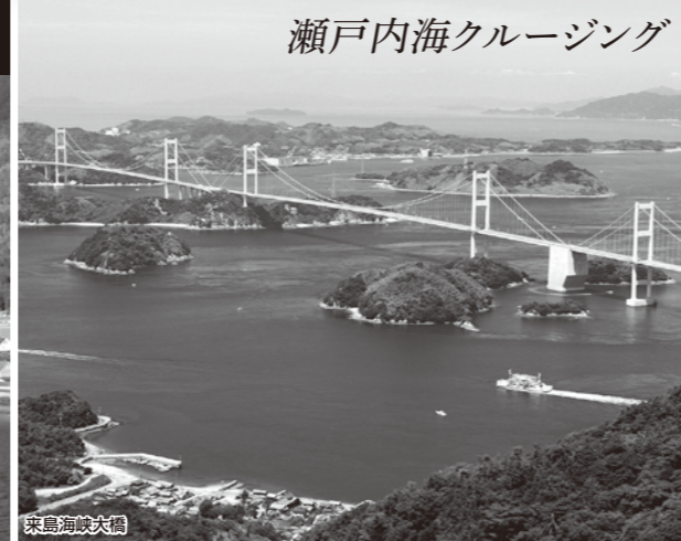
瀬戸内海クルージング