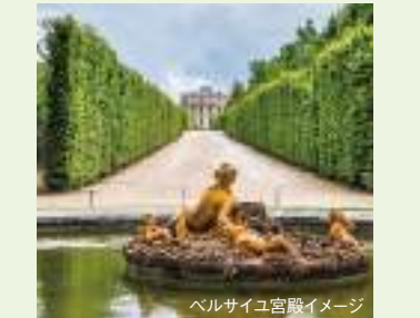
ベルサイユ宮殿イメージ

花の都パリを発着地とするクルーズ。印象派絵画の巨匠、ゴッホ、セザンヌ、そしてゴーギャンらの軌跡をパリからセーヌ川下流のルーアン、続いてノルマンディー地方のコドゥベック＝アン＝コーへと辿ります。第二次大戦中のノルマンディー上陸作戦で有名なビーチを訪れるエクスカーションもご紹介します。