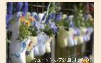
キューケンホフ公園(オランダ)

アムステルダム、ゲント、アントワープなど、絵画のように美しい場所を訪れるクルーズです。特殊な水路に沿って、世界で最も美しいとされる壮大なチューリップ畑や有名な園芸を訪問します。オランダの南部に位置するキューケンホフ公園は、ヨーロッパ最大の花園で、春には世界でいちばん美しいと言われる「ヨーロッパの庭園」です。チューリップや水仙、ヒヤシンスなど700万本以上の花が咲き誇る、この時期にしか見ることのできない景観をぜひご覧ください。