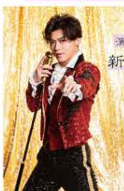
演歌・歌謡歌手 新浜レオン

令和元年にデビュー。令和6年リリースの最新シングル「全てあげよう」は、木梨憲武プロデュース、所ジョージ作詞・作曲。『第75回 NHK 紅白歌合戦』に初出場。今、話題の令和歌謡界の新星のステージに注目!!