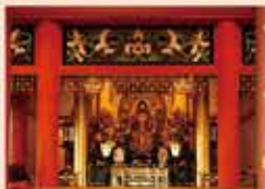
世界遺産 中尊寺 World heritage - Chouson-ji