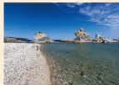
浄土ヶ浜 Shouno Beach - Sagami Bay