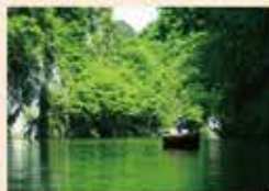
蛸鼻溪 船下り Sho-nasaka - Boat riding