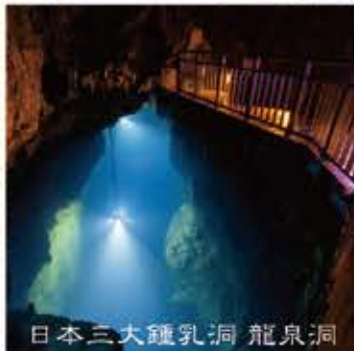
日本三大鍾乳洞 龍泉洞