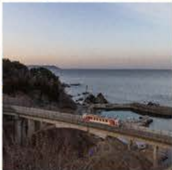
復興のレール 三陸鉄道