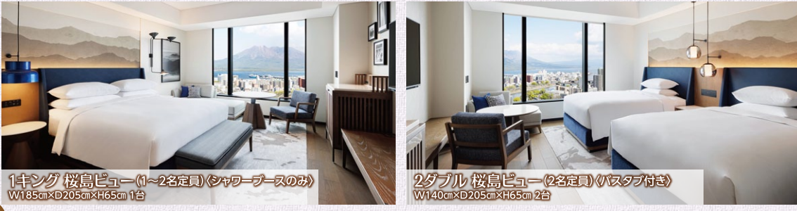
1キング 桜島ビュー(1~2名定員)(シャワーブースのみ) W185cm×D205cm×H65cm 1台