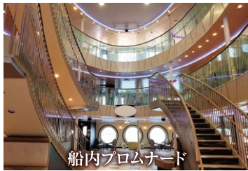
船内プロムナード