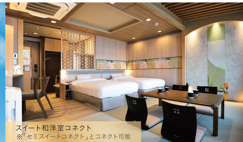
スイート洋室コネク ※「セミスイートコネク」とコネク可能