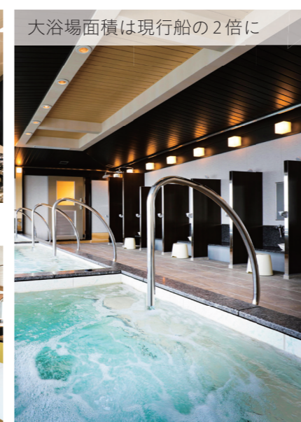
大浴場面積は現行船の2倍に