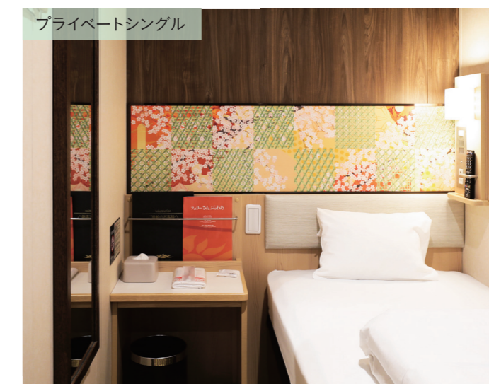
プライベートシングル