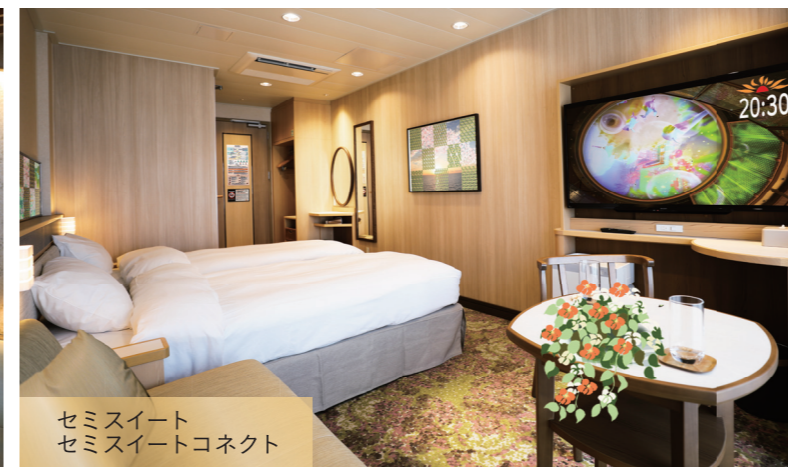
セミスイート セミスイートコネク