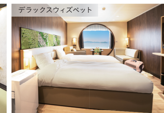
デラックススイズベット