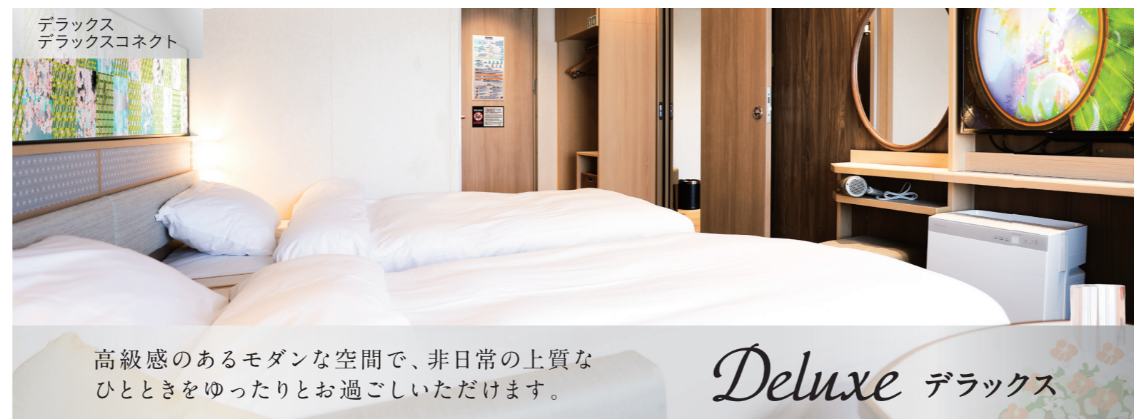
デラックス デラックスコネク

高級感のあるモダンな空間で、非日常の上質な ひとときをゆったりとお過ごしいただけます。