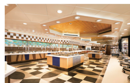
レストランの席数は現行船の1.5倍に