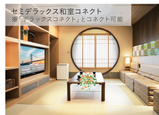
セミデラックス和室コネク ※「デラックスコネク」とコネク可能