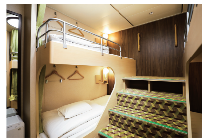
プライベートベッドグループ (写真は4名定員)