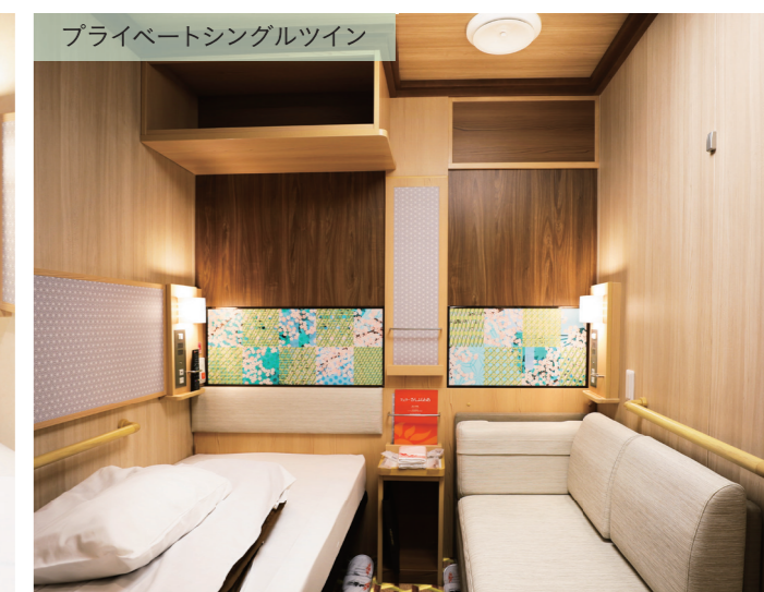
プライベートシングルツイン