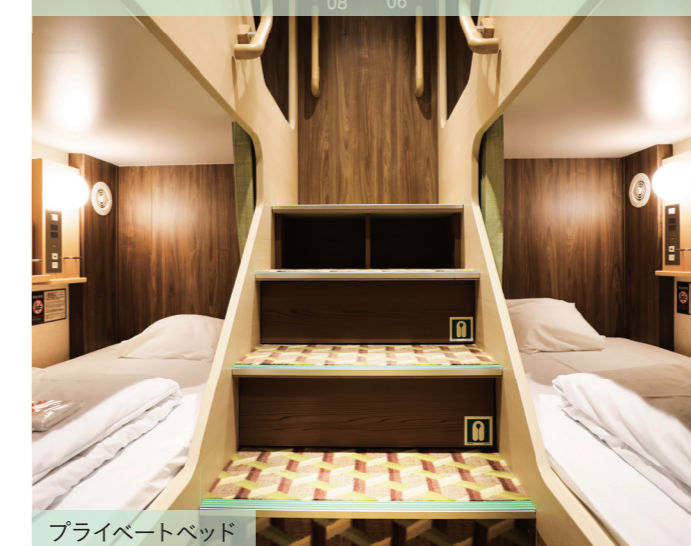
プライベートベッド