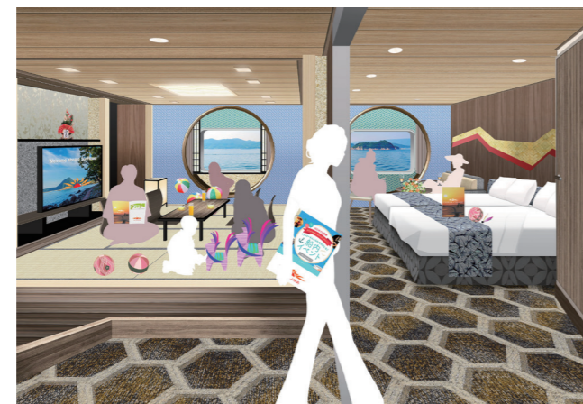
セミスイートコネク (左) スイート洋室コネク (右) ↳ つなげると『コネクティング スイート』