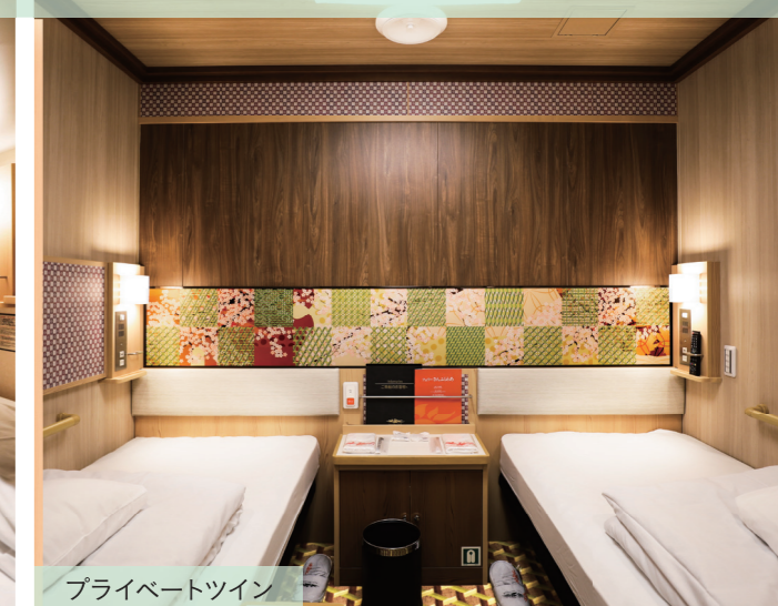
プライベートツイン